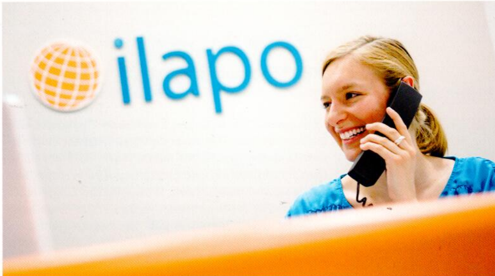
Die motivierten Mitarbeiter und ihre innovativen Ideen sind das größte Kapital von ILAPO