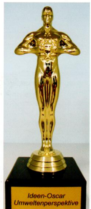
Goldener Junge: Die ilapo Internationale Ludwigs-Arzneimittel GmbH & Co. KG verleiht den Öko-Oscar an den Mitarbeiter mit der besten Idee zur Verbesserung der betrieblichen Energieeffizienz und zum Schutze der Umwelt.